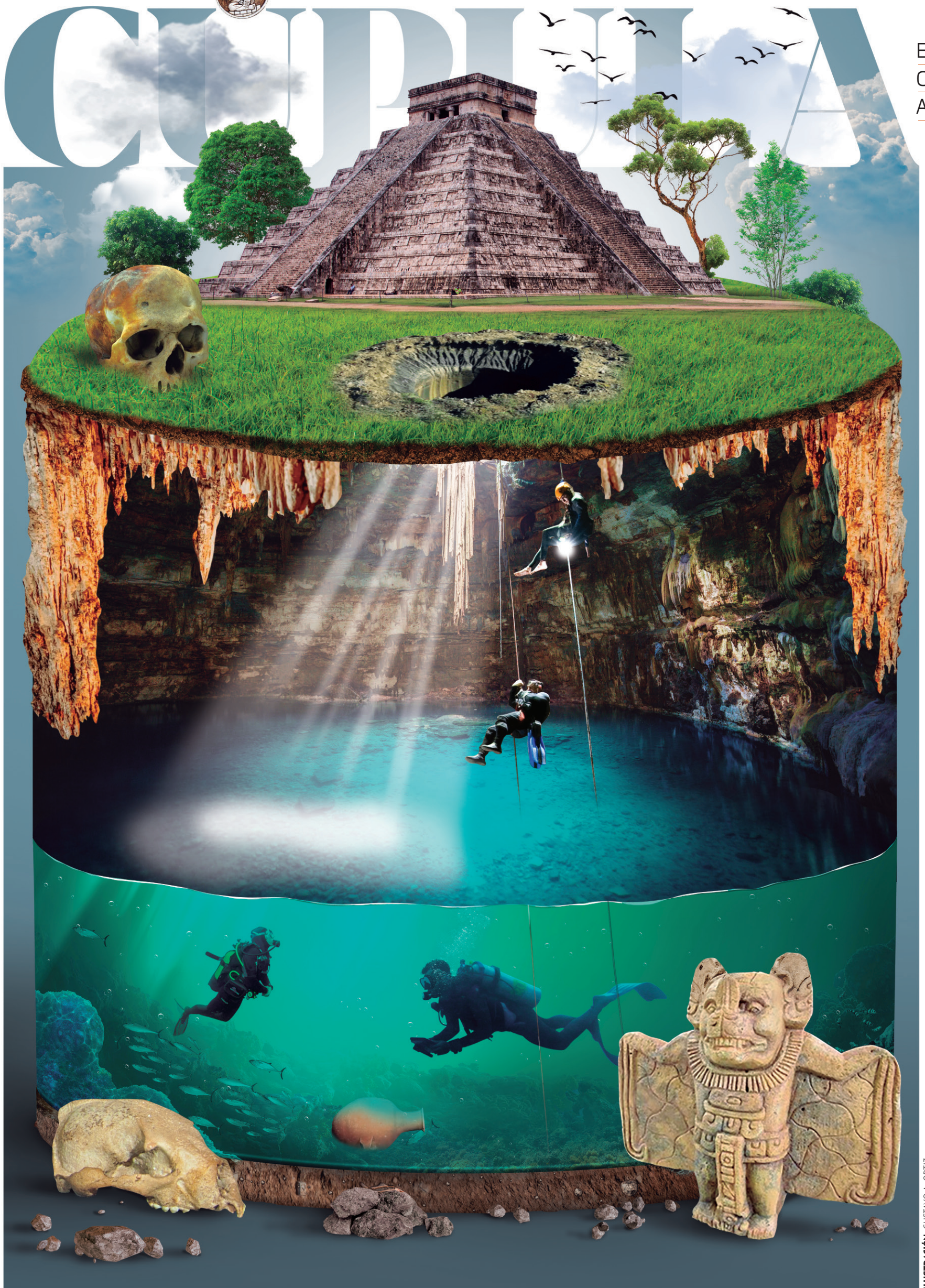
ILUSTRACIÓN: GUSTAVO A. ORTIZ