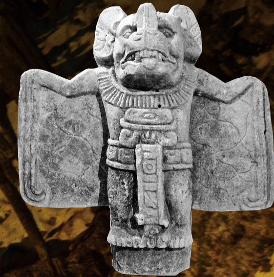
FIGURA. Murciélago antropomórfico, posiblemente de Copán.

que representan? En la mayoría de los casos no es así. Además, Seler (1904) identificó un parecido entre las figuras en la vasija Chama y las deidades murciélagos representadas en los códices del posclásico tardío del Centro de México y fue así que utilizó estas como base para la interpretación de las vasijas mayas. En el Códice Borgia , el dios murciélago está representado lamiendo la sangre de la herida abierta en el pecho de una persona (Seler 1904:235). En el retrato, la deidad lleva puesta una cabeza trofeo en el pecho. El Códice Vaticanus B muestra el murciélago antropomórfico decapitando a un individuo y tiene una cabeza humana decapitada en la otra mano. En el Códice Fejérváry-Mayer un murciélago antropomórfico está representado con un corazón en una mano y una cabeza decapitada en la otra (Seler 1902-03: Fig. 38). El Códice Porfirio Díaz muestra un murciélago antropomórfico sosteniendo un corazón en una mano y una cabeza humana en la otra (Thompson 1966: 181). El hecho que los murciélagos